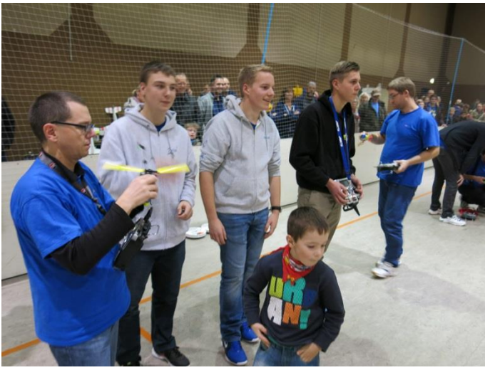
Ein Gastpilot fühlte sich gar selbst ganz beflügelt: