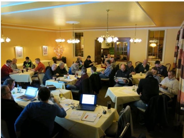
27 Mitglieder sind zur JHV gekommen! 59% Beteiligung, Toll !!!